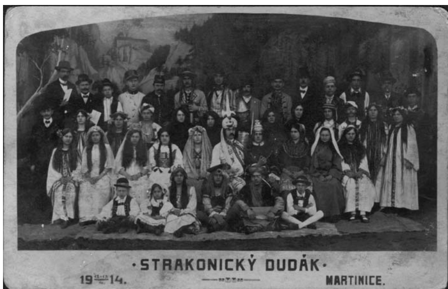
Příležitostná pohlednice vydaná r. 1914 ke hře „Strakonický dudák“