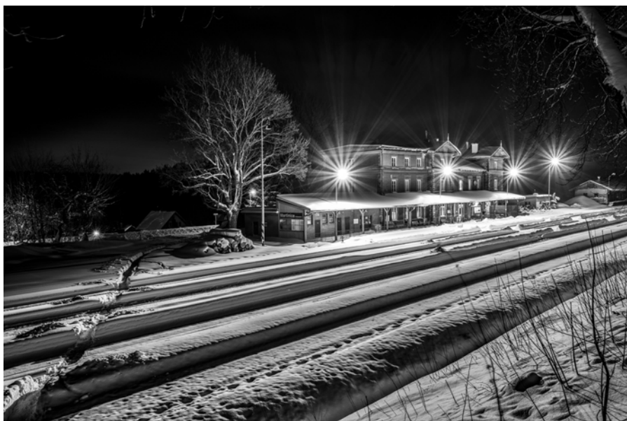
Sněhová nadílka ve stanici | 6. 1. 2017

Spolek má ve svých záměrech představit nádraží Martinice nejen jako historickou a stále bezvadně fungující stanici pro pravidelné cestující, ale také jako místo setkávání zájemců o železniční historii. K tomu všemu by měly sloužit čtyři základní pilíře, z nichž každý má svoji nezastupitelnou úlohu. Prvním je samotná výpravní budova. Prostory bývalé restaurace plánujeme obnovit do původního vzhledu a vybudovat zde zázemí spolku a muzeum stanice a lokálky . Na chodbách vstupní haly umístíme nástěnky s informacemi o kulturní památce. O našich záměrech jsme již úspěšně jednali se správcem objektu SON SŽDC Hradec Králové. V současné době dohadujeme podmínky nájmu potřebných prostor. Možností využití prostor ve staniční budově je mnohem více, ale horizont realizace je tak vzdálený, že se o nich zde zatím nebudu rozepisovat. Druhým pilířem je naučná stezka . Bude se jednat